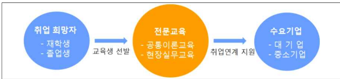
<바이오인력양성 프로그램 구조>