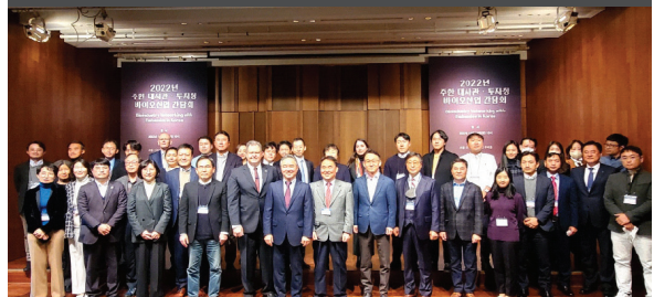
2022년 주한 대사관 투자청 바이오산업 간담회