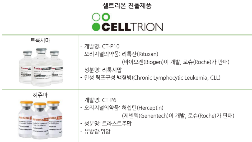
[표 1] 셀트리온의 미국시장 진출 제품