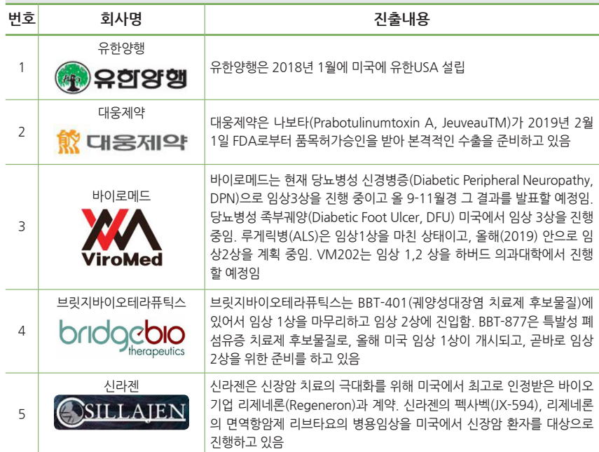
[표 2] 우리나라 증견기업 진출 현황

그밖에 미국시장에 진출한 우리나라 증견기업으로는 유한양행, 대웅제약, 바이로메드, 브릿지 바이오테라퓨틱스, 신라젠, 에이치엘비, 인트론바이오 등이 있다.