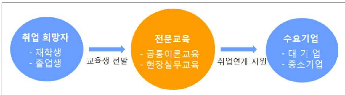
<바이오인력양성 프로그램 구조>