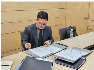
2024. 4. 16(화)/리가켄 바이오사이언스