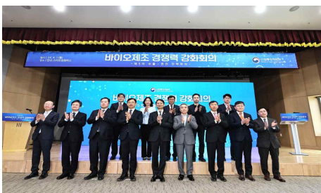
2024. 4. 1(월)/판교 스타트업캠퍼스