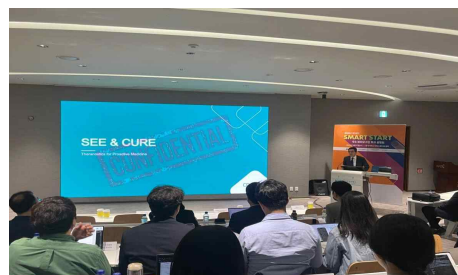
2024. 4. 17(수)/서울 한국거래소 IR 센터

참석 기업 간 개발 현황 및 정보 공유, 규제 등 기업 애로사항 의견 청취