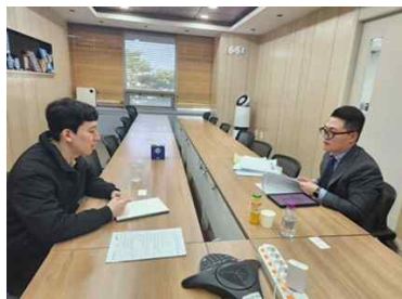
2024. 4. 18(목)/뉴라클사이언스