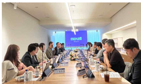
2024. 4. 4(목)/대상 이노파크(마곡 연구소)